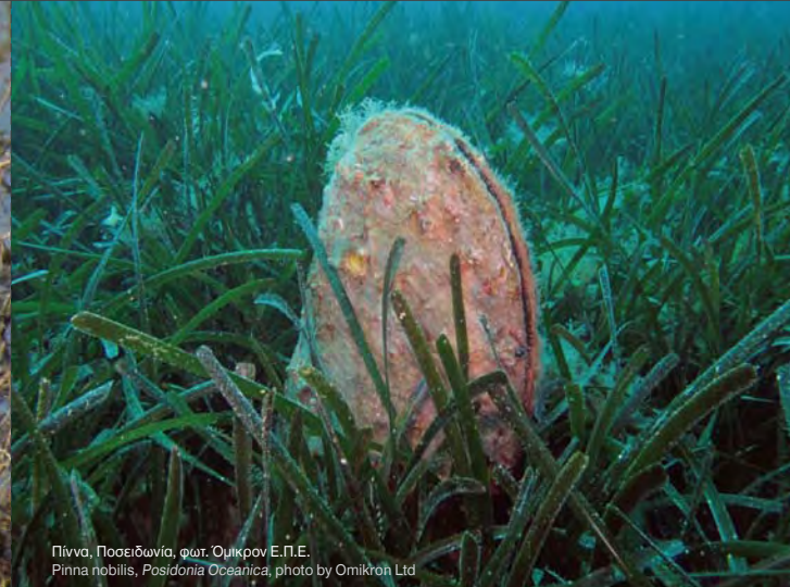
Πίννο, Ποσειδωνία, φωτ. Ομίκρον Ε.Π.Ε. Pinna nobilis, Posidonia oceanica, photo by Omikron Ltd