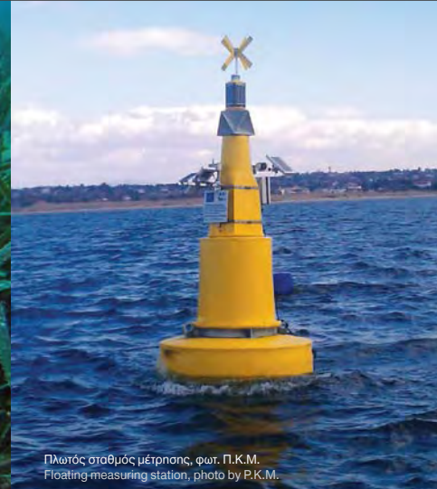
Πλωτός σταθμός μέτρησης Floating-measuring station