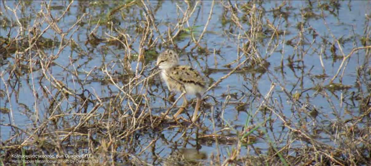
Κοιμωκός νεσσός Himantopus himantopus