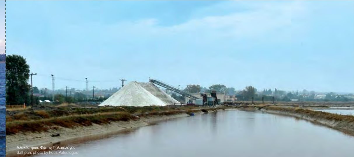
Αλικές, φωτ. Φώτης Παλαιολόγος Salt pan, photo by Fotis Paleologos